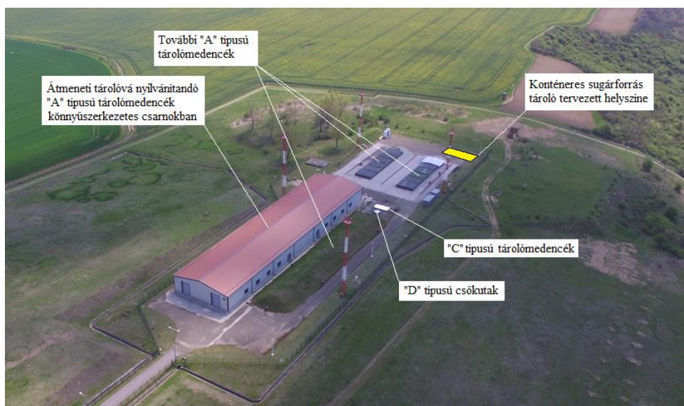
2. ábra. Az Üzemeltetési Engedély módosításával érintett lényegi változások az RHFT ellenőrzött területén

A tervezett változtatásokat a létesítmény meglévő rendszereihez képest a 2. ábra mutatja be.